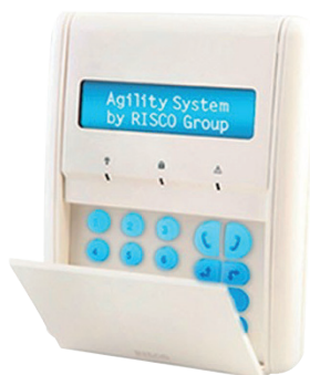
Clavier LCD / lecteur de badge