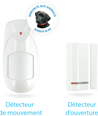
Détecteur de mouvement